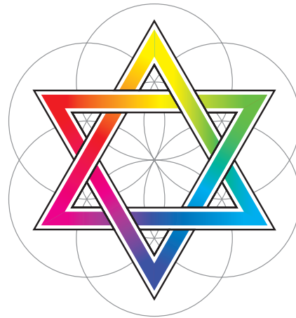
Le mariage du Ciel (synthèse additive : lumière) et de la Terre (synthèse soustractive : pigments) constituant le Sceau de Salomon

Les couleurs du Tarot de Marseille sont au nombre de sept, plus le noir et le blanc, lesquels sont, dans l'art sacré, des couleurs à part entières. Ces couleurs forment ensemble une ennéade, qui exprime sur le mode lumineux l'ensemble des possibilités universelle N17 . Du plus sombre au plus clair, ou du plus au moins matériel, ces couleurs sont : le noir, le bleu sombre, le vert sombre, le rouge, le vert clair, le bleu clair, le chair (nuance claire de jaune-orangé), le jaune et le blanc.